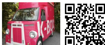
キッチンカー開業セミナー