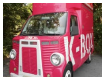
キッチンカー開業セミナー