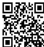
キッチンカー開業セミナー